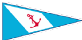
YACHT CLUB ARGENTINO