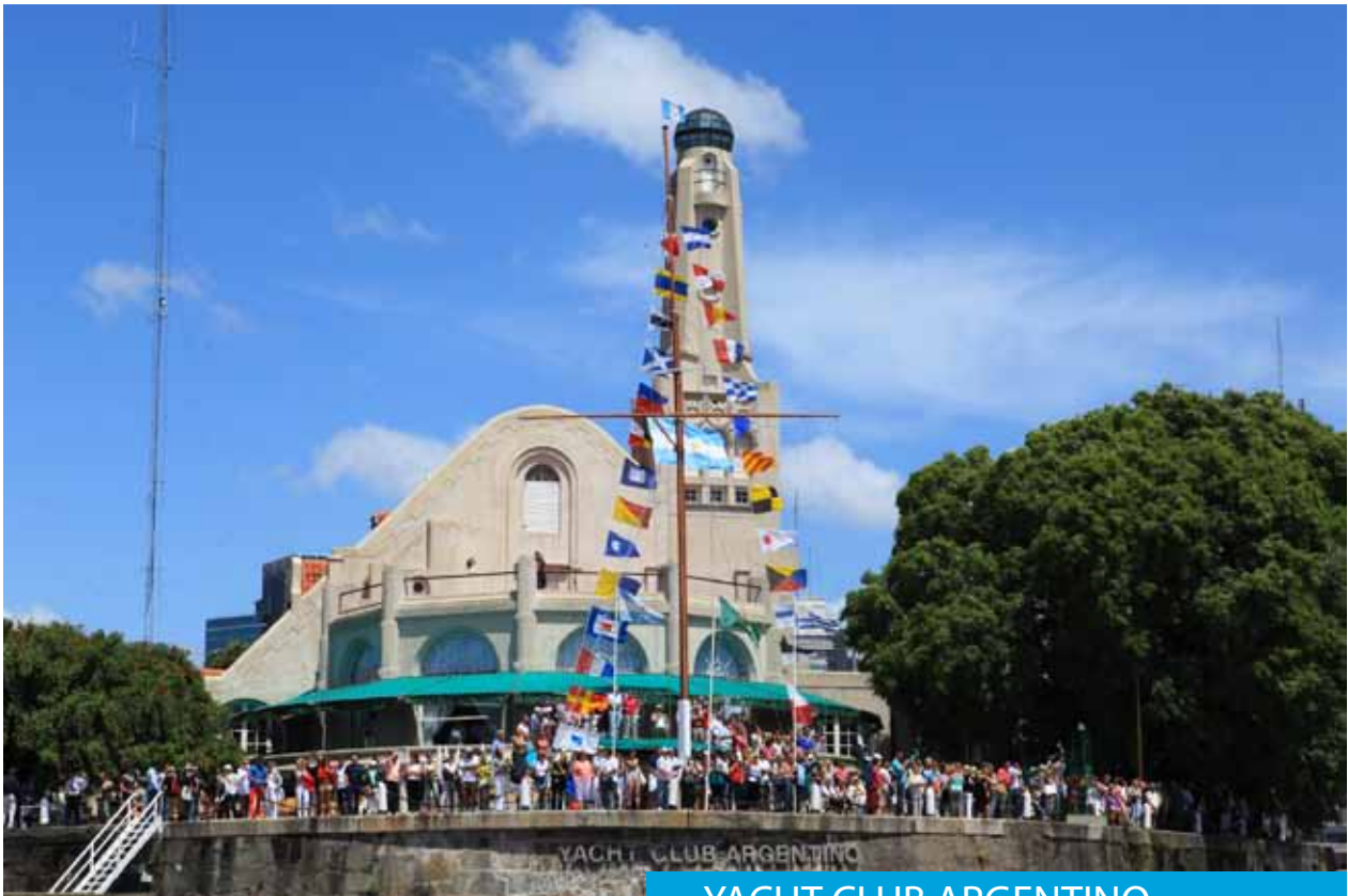
YACHT CLUB ARGENTINO